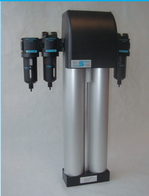
Adsorptionstrockner mit 5 µm Vorfilter und Feinfilter 0,01 µm

Der SPECKEN-DRUMAG-Adsorptionstrockner arbeitet nach dem Prinzip der Druckwechselregeneration.