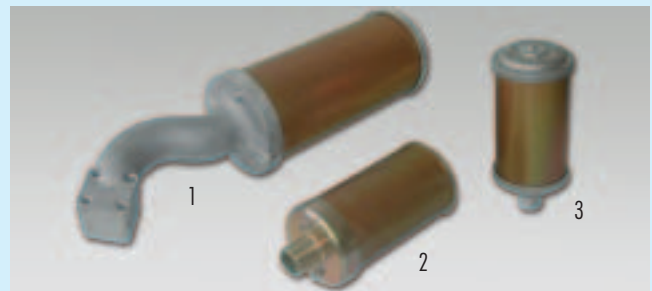
1 und 2 kundenspezifische Lösungen, 3 Hochdruckschalldämpfer Serie P